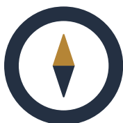
CAMP 2 NAVIGER I PARADOKSER