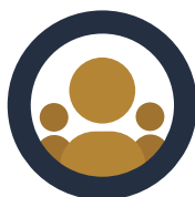
CAMP 3 LED MENNESKER