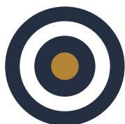
CAMP 1 STRATEGISK TÆNKNING

Som ekstra benefit ved tidlig tilmelding til dit MBA studie, sætter vi turbo på din evne til problemløsning gennem fire gratis Start Up Bootcamps. Sammen med andre kandidater arbejder du med konkrete ledelsesudfordringer fra din egen dagligdag. Du kommer til at opleve workshops, der sætter fokus på praktisk problemløsning, der hele tiden er sat i forhold til din hverdag og dine udfordringer. Vi ønsker, at du allerede nu skal højne din interne værdi i virksomheden ved at kvalificere dig til at træffe endnu bedre beslutninger og til at føre dem ud i livet. Du bliver virksomhedens garant for fremsynet ledelse.